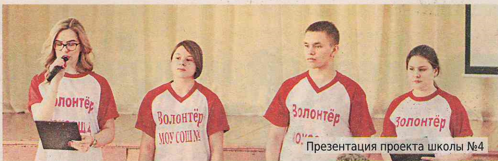
Презентация проекта школы №4