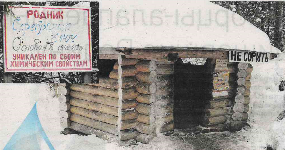
Родник «Серебряный ключик»