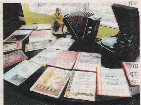
«Книги памяти» учеников школы № 2

лионов погибших советских людей. Поначалу я не могла осознать, насколько это большое количество. А ведь каждую семью в нашей стране задело страшное слово «война».