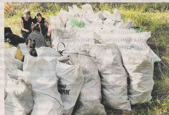
собрали 250 мешков мусора...